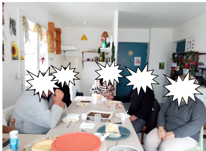
Repas de Noël. Dommage que la neige ait empêché certains participants de partager ce beau moment.