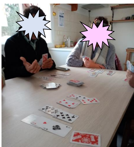
Les parties de cartes sont toujours appréciées