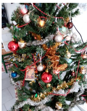
Le groupe a décoré la pièce et le sapin de Noël